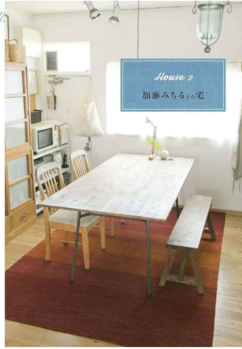
House 2 加藤みちるさん宅